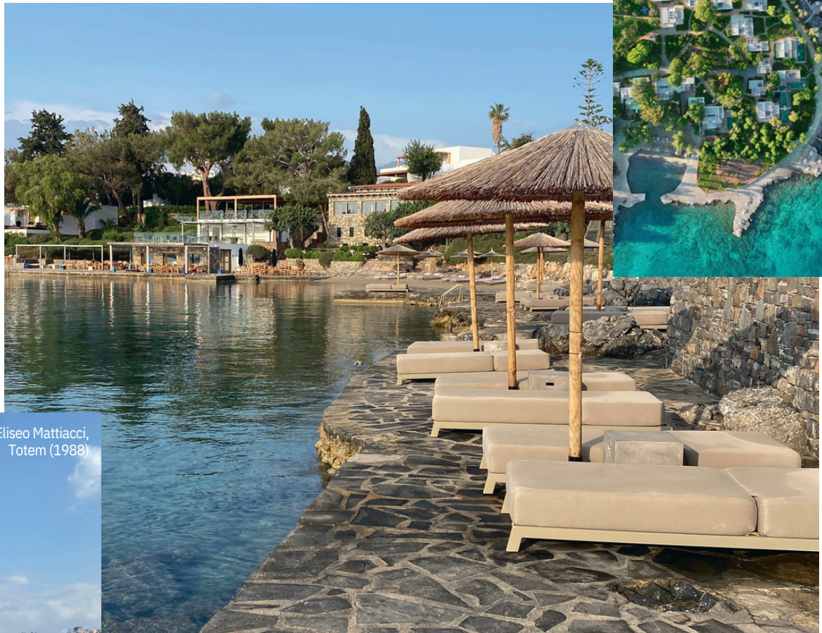
Eliseo Mattiacci, Totem (1988)

Minos Beach art hotel er en del af Design Hotels, der er en global samling af mere end 300 uafhængige designdrevne hoteller. Fra København til Bali og Maldiverne. Se dem alle på designhotels.com .